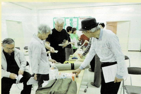
地震対策部品の説明

地震に無関心では、自分や家族を守れません。 ぜひ「防災塾」へ足を運んでください。