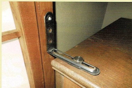
整理ダンスの転倒防止 (L金具を使用)