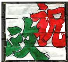
しゅくせい 2010年(平成22年)