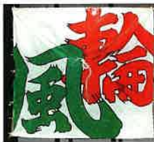
2020年(令和2年) 2021年(令和3年) ※大凧揚げ中止