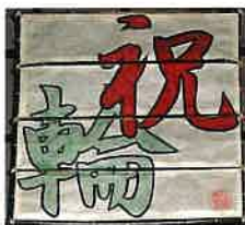
しゅくりん 1964年(昭和39年)