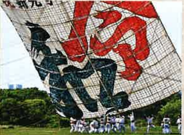
【相模の大風センター展示品】