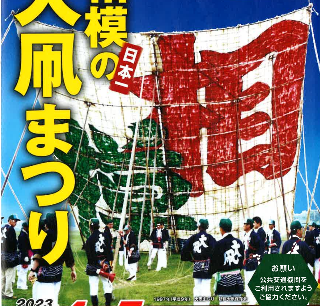
1997年(平成9年) 大凧まつり 新戸大凧保存会