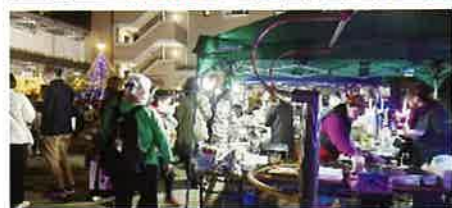
イルミネーション点灯式 R4.11.27