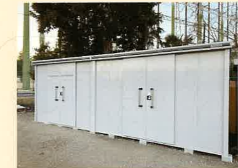
町内会創立60周年事業の一環として、防災倉庫がリニューアル