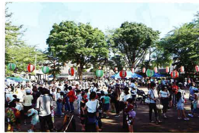
初めてお祭りに参加するという子供さんも！

7月24日(土)相武台前二丁目公園で3年ぶりに「夏フェス」と銘打った夏祭りを開催しました。久しぶりの地域の祭りに近隣住民の多くの方々が参加されました(主催者発表で約三千人参加)。太鼓の打ちだしから始まり、様々な団体がダンスや演奏を披露して、祭りを盛り上げてくれました。商店街や地域で活動している団体の模擬店やフリーマーケットも大盛況。マスク着用や手指の消毒などコロナ対策を実施しつつ、With コロナで地域に活気を取り戻す取組となりました。