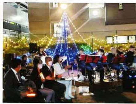
相模原・座間両市長も点灯式に参列

11月27日(日)点灯式を行いました。相武台前町内会・商店街と座間の相武台自治会・商店会が共同で相武台前公園とGATE4に続く通りにイルミネーションの飾り付けをしました。