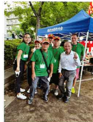
本村市長も祭りに参加

7月24日(土)相武台前二丁目公園で3年ぶりに「夏フェス」と銘打った夏祭りを開催しました。久しぶりの地域の祭りに近隣住民の多くの方々が参加されました(主催者発表で約三千人参加)。太鼓の打ちだしから始まり、様々な団体がダンスや演奏を披露して、祭りを盛り上げてくれました。商店街や地域で活動している団体の模擬店やフリーマーケットも大盛況。マスク着用や手指の消毒などコロナ対策を実施しつつ、With コロナで地域に活気を取り戻す取組となりました。