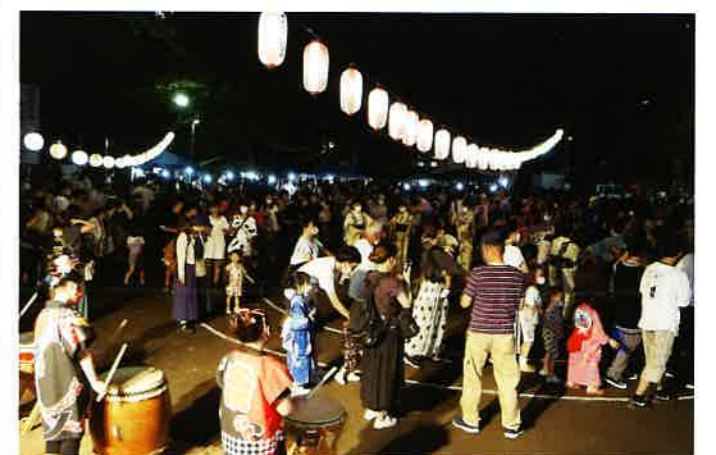
段々と踊りの輪が幾重にも広がりました