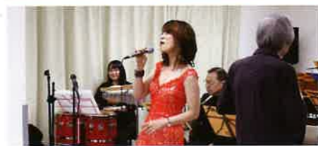
X'mas コンサート R4.12.24