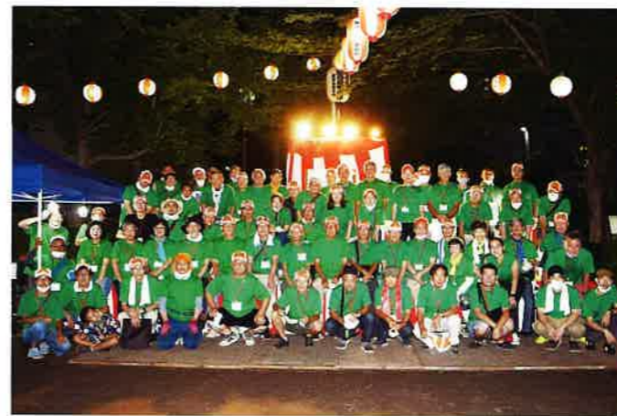
実行委員で記念撮影。3年ぶりの開催に不安もありましたが、参加者の笑顔に疲れが吹き飛びました！