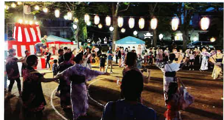
祭りのフィナーレは盆踊り。輪になって踊りました