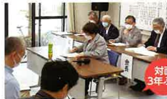
自治会連合会総会 R4.4.24